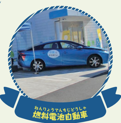
ねんりょうでんちじどうしゃ 燃料電池自動車