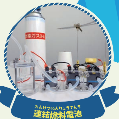
ねんりょうでんち 連結燃料電池